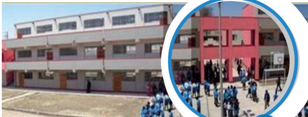
I.E. Nuestra Señora de las Mercedes - Ica