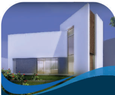
Residencial Social Marketing