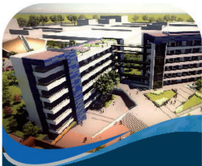
Educacional Social Marketing