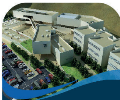
Concursos Social Marketing