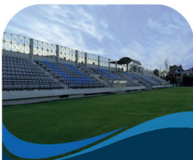
Deportiva Social Marketing