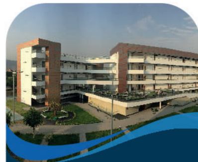
Institucional Social Marketing